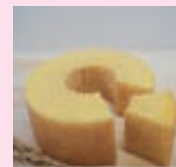
米粉スイーツ販売