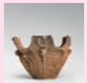
文化財パネル展示